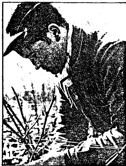
1. A l'approche du printemps, on taille la vigne.